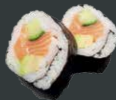
26. Laks Big/laks, avocado, agurk 60 kr./100 kr.