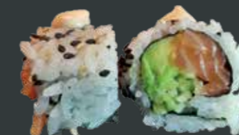
38. Spicy laks/laks, agurk, avocado, chilimayo 83 kr.