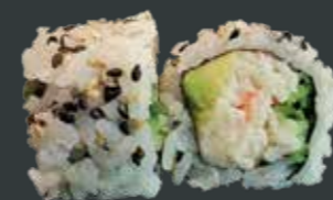
34. California/ surimi, agurk, avocado, sesam 78 kr.