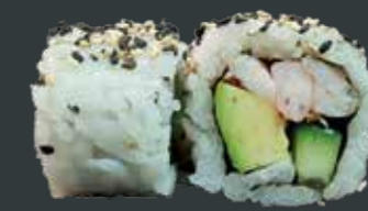
42. Spicy ebi/rejer, avocado, agurk, chilimayo 82 kr.