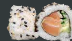
35. Laks roll/laks, agurk, avocado, sesam 79 kr.