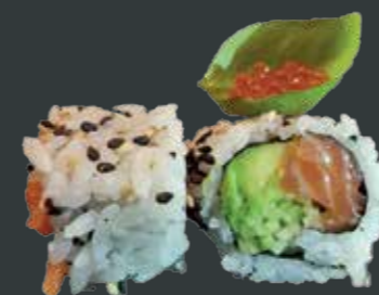
37. San Francisco/laks, basilikum, agurk, avocado, laksrogn 92 kr.