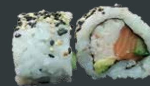
36. Super california roll/surimi, laks, agurk, avocado 79 kr.