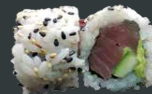
39. Tun roll/tun, agurk, avocado 80 kr.