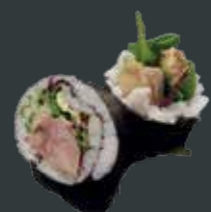
31. And roll/Grillet and, agurk, avocado, mix salat, teriyaki sauce 68 kr./121 kr.