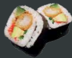
32. Ebi tempura/tempura ebi, agurk, avocado, flyvofiskerogn, chilimayo, mix salat 79 kr./139 kr.