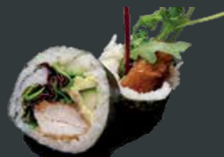
29. Super chicken/inbagt kylling, avocado, agurk, teriyaki, chilimayo, mix salat 66 kr./114 kr.