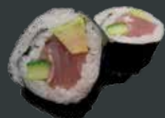
27. Tun Big/tun, avocado, agurk 62 kr./100 kr.