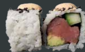
40. Spicy tun/tun, agurk, avocado, chilimayo 84 kr.