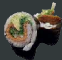
25. Vegetar roll/tofu, tang salat, agurk, avocado 60 kr./100 kr.