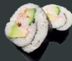
28. Ebi Hot/rejer, avocado, agurk, chilimayo 60 kr./100 kr.