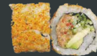
41. Super spicy tun/tun, fiskerogn, avocado, agurk, chilimayo, chilipulver 88 kr.