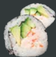
24. California Big/surimi, avocado, agurk 60 kr./100 kr.