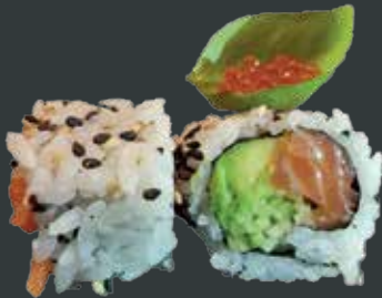
37. San Francisico/laks, basilikum, agurk, avocado, laksrogn 96 kr.