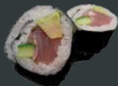
27. Tun Big/tun, avocado, agurk 65 kr./105 kr.