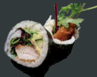
29. Super chicken/inbagt kylling, avocado, agurk, teriyaki, chilimayo, mix salat 68 kr./116 kr.