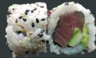
39. Tun roll/tun, agurk, avocado 82 kr.