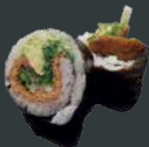
25. Vegetar roll/tofu, tang salat, agurk, avocado 62 kr./104 kr.