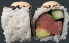
40. Spicy tun/tun, agurk, avocado, chilimayo 86 kr.