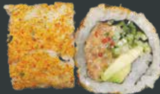
41. Super spicy tun/tun, fiskerogn, avocado, agurk, chilimayo, chilipulver 92 kr.