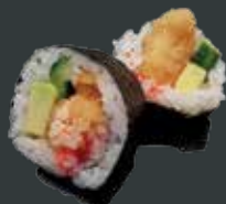
33. Crispy laks/indbagt, laks, agurk, avocado, flyvefiske- rogn, wasabi mayo, jordnødder 76 kr./135 kr.