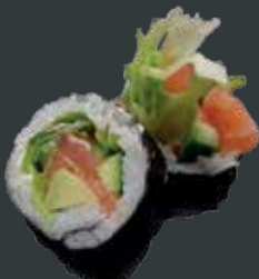
30. Sake laks/laks, agurk, avocado, flødeost, mix salat 65 kr./106 kr.