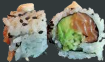
38. Spicy laks/laks, agurk, avocado, chilimayo 85 kr.