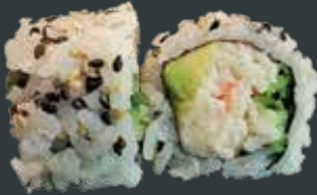
34. California/ surimi, agurk, avocado, sesam 79 kr.