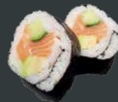
26. Laks Big/laks, avocado, agurk 62 kr./104 kr.